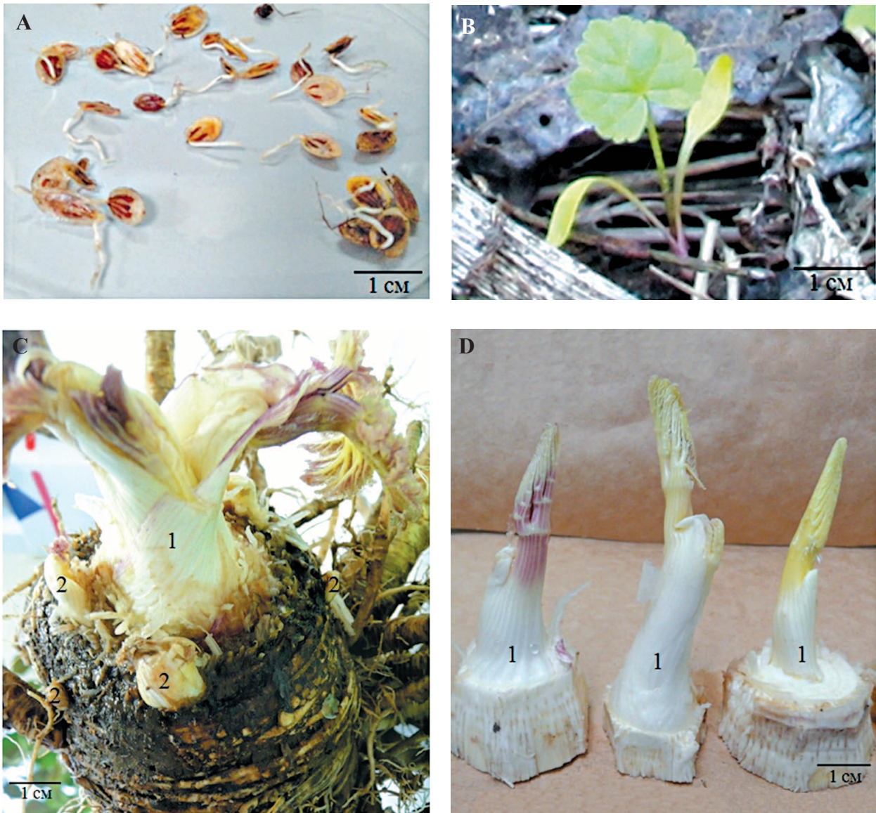
Рис. 1. Проростки Heracleum sosnowskyi с корешком (А, март), всходы с первым настоящим листом (В, апрель-май), стеблекорень (С, октябрь), отделённая терминальная почка (D, октябрь): 1 – терминальная почка, 2 – латеральная почка Fig. 1. The seedlings of Heracleum sosnowskyi with radicles (A, March), seedlings with the first true leaf (B, April-May), caudex with roots (C, October), and terminal buds (D, October): 1 – terminal bud, 2 – lateral buds