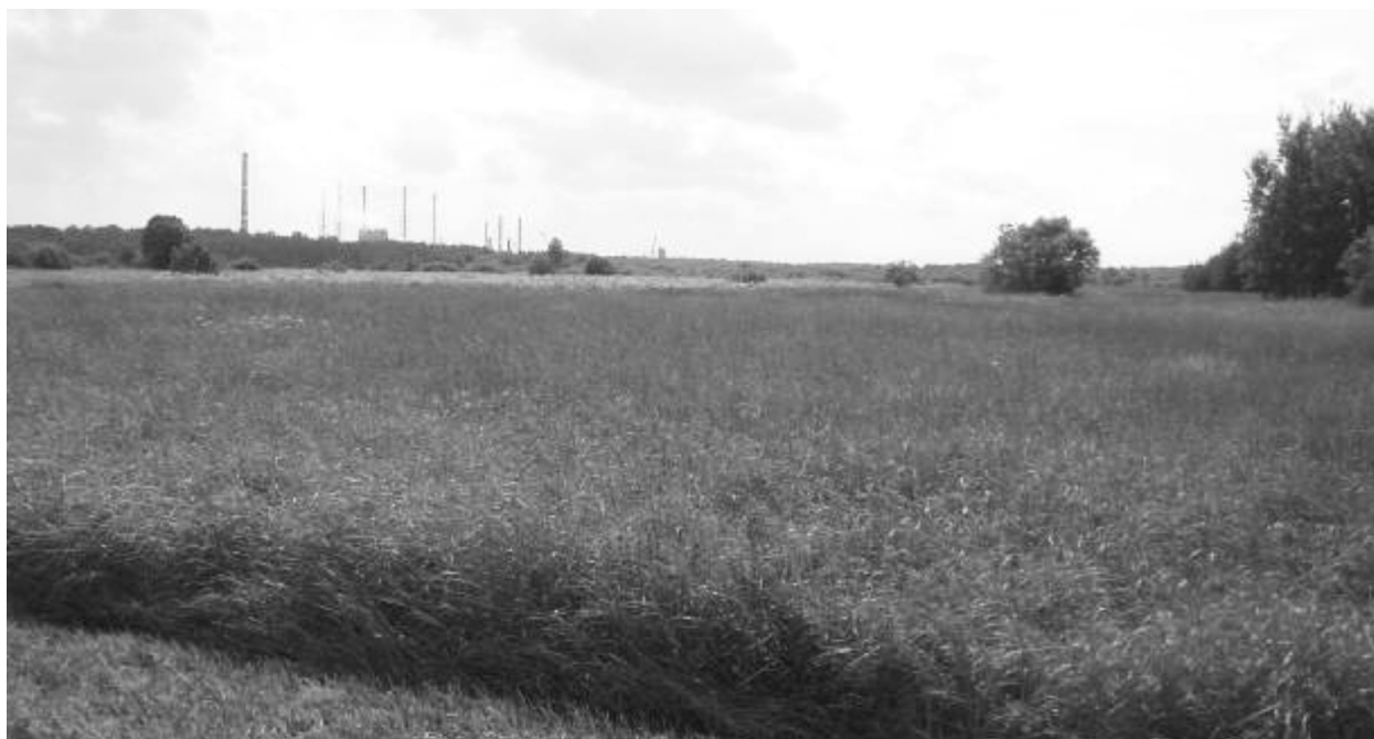
Рис. 2. Состояние луга после внесения умеренных доз азота

Увеличение сомкнутости травостоев привело к отмиранию и подавлению многих неконкурентоспособных видов. Прекращение скашивания и хорошее обеспечение элементами питания за счёт отмирающей растительности, а также высокий паводок 2016 г. активизировали развитие корневищных злаков, крупностебельного корневищного и корот-