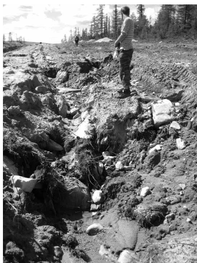
Рис. 2. Деструктивные процессы в высокогорье.

Наиболее сложными и экстремальными в инженерно-геологическом плане являются высокогорные пространства, самое примечательное из которых – район плоскогорья Укок. Чаще оно именуется плато и находится в южной наиболее возвышенной части Алтая, на стыке границ России, Казахстана, Китая и Монголии, среди скалистых гор, достигающих высоты около 3 000 м. Особую известность оно получило после открытия в шестидесятые годы двадцатого века в его пределах разнообразных скифских курганов с замёрзшими хорошо сохранившимися погребениями. Очень важно, что памятники дошли до исследователей в совершенно ненарушенном состоянии,