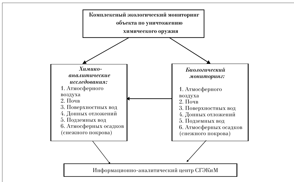
Рис. 3. Организация наблюдений за состоянием компонентов природной среды

В таблице приводятся данные, характеризующие работу СГЭКиМ действующих